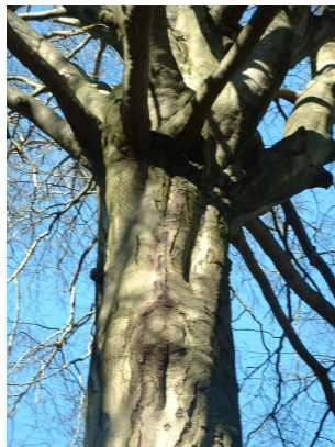
, 14 Mars 2003