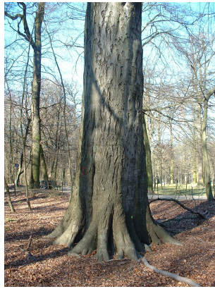
, 14 Mars 2003