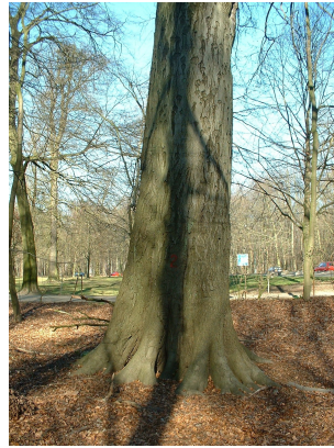
, 14 Mars 2003