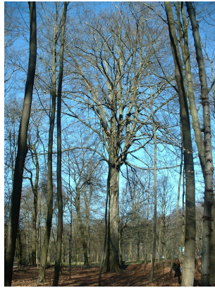
, 14 Mars 2003